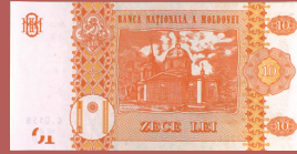
Bancnota de 10 lei - revers 10 lei banknote - back side