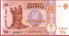
Bancnota de 50 lei - avers 50 lei banknote - front side