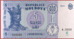
Bancnota de 5 lei - avers 5 lei banknote - front side