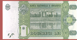
Bancnota de 20 lei - revers 20 lei banknote - back side