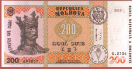
Bancnota de 200 lei - avers 200 lei banknote - front side