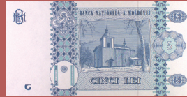
Bancnota de 5 lei - revers 5 lei banknote - back side