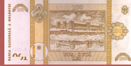
Bancnota de 100 lei - revers 100 lei banknote - back side