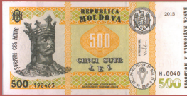
Bancnota de 500 lei - avers 500 lei banknote - front side