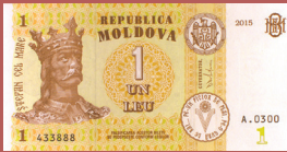
Bancnota de 1 leu - avers 1 leu banknote - front side