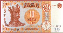
Bancnota de 10 lei - avers 10 lei banknote - front side