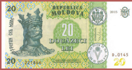
Bancnota de 20 lei - avers 20 lei banknote - front side