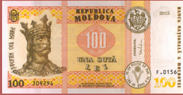
Bancnota de 100 lei - avers 100 lei banknote - front side