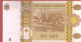
Bancnota de 1 leu - revers 1 leu banknote - back side