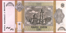
Bancnota de 500 lei - revers 500 lei banknote - back side