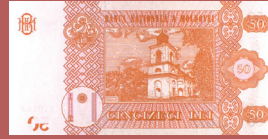
Bancnota de 50 lei - revers 50 lei banknote - back side