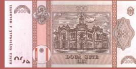
Bancnota de 200 lei - revers 200 lei banknote - back side